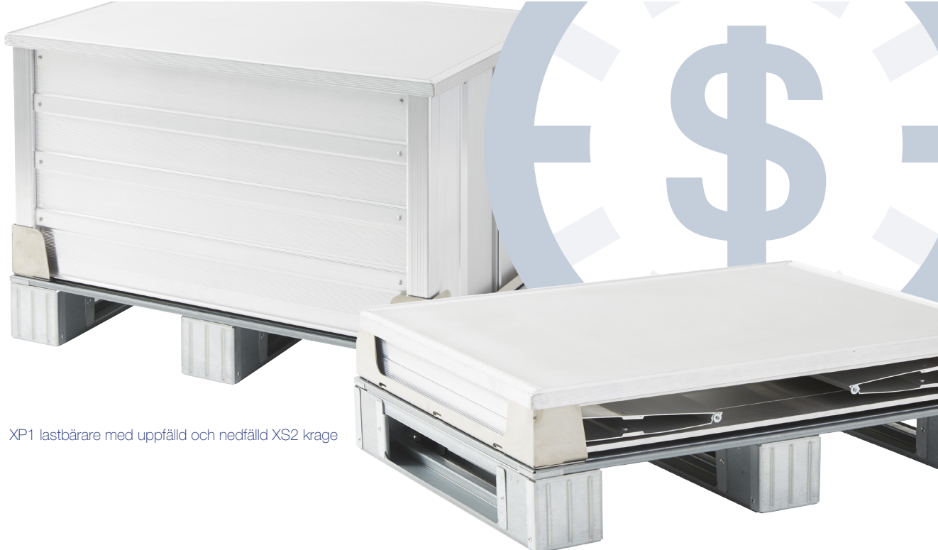
XP1 lastbärare med uppfälld och nedfäld XS2 krage

För att minimera riskerna för skador är det viktigt att tänka på helheten och att tänka till innan i alla lägen, när en arbetsplats skall organiseras, ett arbetsmoment skall utformas utifrån arbetsrörelser och nödvändiga kroppsställningar. Är arbetsutrymmet är tillräckligt stort för att utföra lyft och förflyttningar är en av många frågeställningar att hantera för att skapa en så optimal arbetssituation som möjligt för att kunna utföra arbetet utan risk för olika typ av skador. Crossborders lastbärarsystem XP1 plus XS2 ger goda egenskaper avseende användarergonomi, användarflexibilitet och smidighet. Lastbärarsystemet förbättrar såväl ergonomi som arbetsmiljö för användaren.